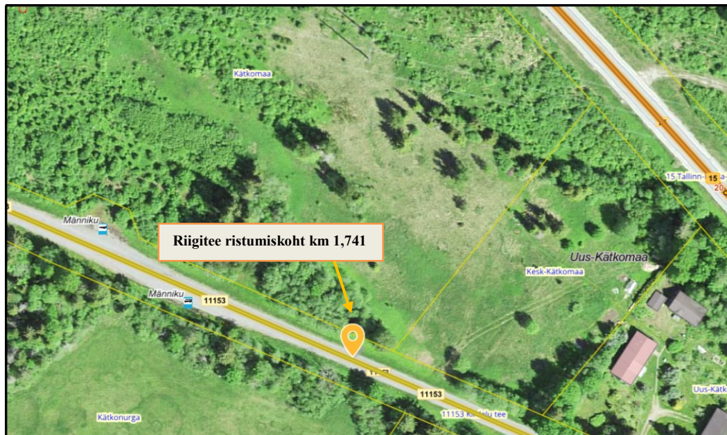
Joonis 1. Planeeritava ristumiskoha orienteeruv asukoht